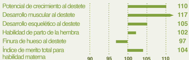
IBOVAL indice en finca hasta el destete (animales puros)