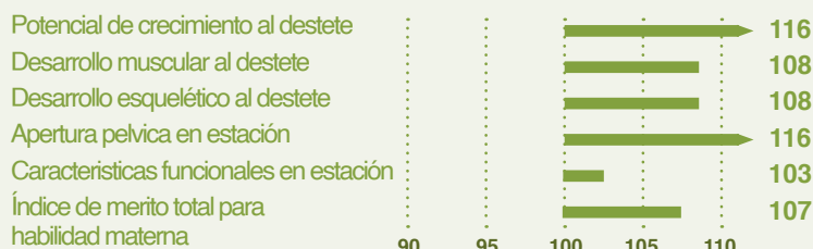
IBOVAL indice en finca hasta el destete (animales puros) & Índice de evaluación individual en estación de control