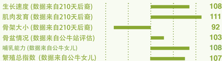
Index from Progeny Evaluation & Station of Evaluation