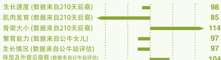
Index from Progeny Evaluation & Station of Evaluation