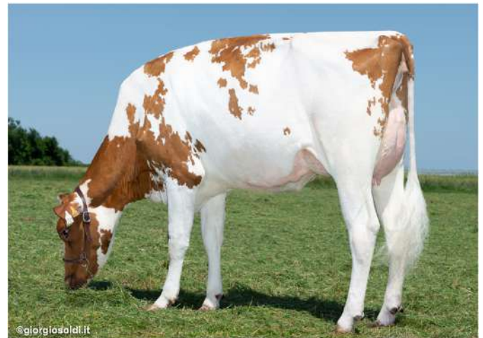
Saluden Paprika VG-86, Großmutter von Uheleg PP

→ Bei den töchtergeprüften Bullen \geq 90 Sicherheit sind wir stolz darauf, über Pradenn mit 172 ISU und sehr ausgewogenem Profil zu verfügen. Nove , Enkel von Ladd P und Red Izisa P (Grand Champion bei SPACE 2027) punktet mit +3,0 in der Eutergesundheit und +2,6 im Typ. Olist P mit 428 Töchtern ist immer noch bei +2,9 im Typ.