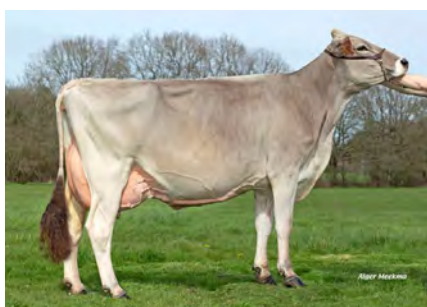
Mutter: Olysee GP-82