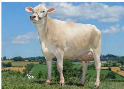
Mutter: Pennie GP-82

Der höchste ausländische Bulle in DE aus einer neuen Kuhfamilie