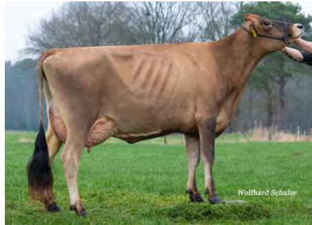
Hija de Crystal P : Jessy Criador: Eiting, Wiefelstede