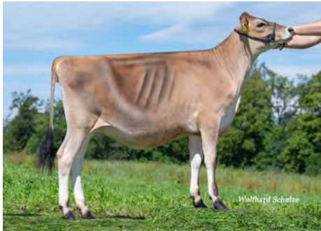
Hija de Downtown Brown : Daisy-J Criador: Peter Heinzer

El programa de selección Jersey SYNETICS aún es joven; sin embargo, las primeras hijas de estos toros ya han parido y subrayan el objetivo y nuestra pasión por brindarle una gama completa y ampliamente utilizable de toros Jersey.