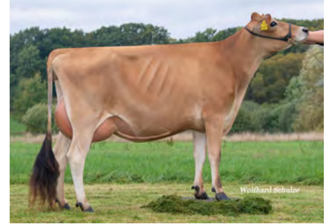
Hija de Dilbert-P : Ulijana Criador : Jäger, Kirchlinteln

Estamos buscando toros que combinen índices positivos y el DPR más alto posible. Un lineal impecable de una familia de vacas profundas completa nuestra oferta.