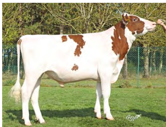
SERIEUX Né au GAEC JALLAT BEAUDONNAT (63)

Et en semence sexée à partir de mi-mai 2023