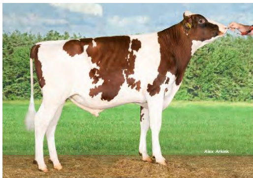
BULLDOZER P CRV – PAYS-BAS