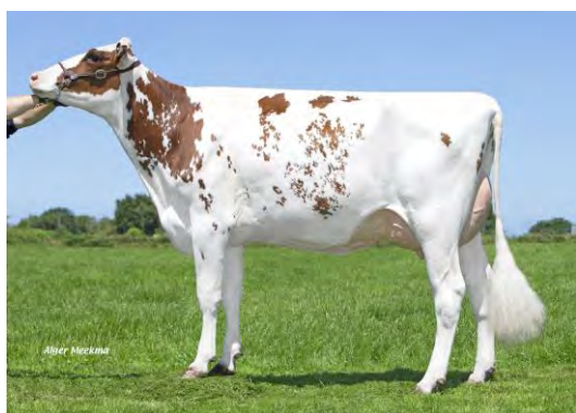
Grand-Mère : NORWAY 90 Pts Né au GAEC CLOAREC-JOLLE (29)

Disponible dès maintenant en semence conventionnelle