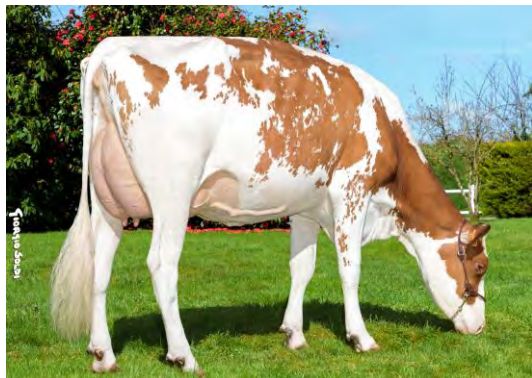
Mère : Rose 84 pts Né au GAEC DES RUBIS (29)