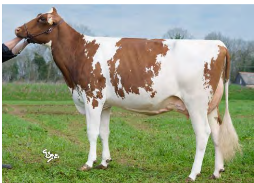
Mère : PSITRAVE Né à L'EARL DU QUINQUIS (56)

Et en semence sexée à partir de Juin 2023