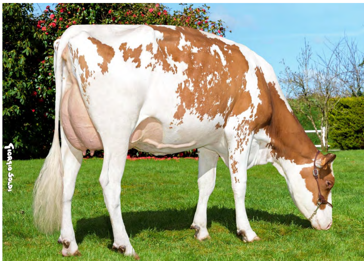
Rose – fille de NIRVANA PR et mère de TERIVES – GAEC DES RUBIS (29)