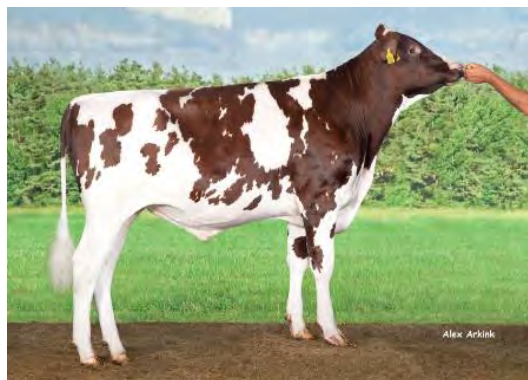
BORAX CRV – Pays Bas

Disponible dès maintenant en semence conventionnelle